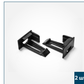
2 шт. Механизм фиксации тяговой планки