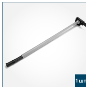
1 шт. Механизм пружинный с левой боковой крышкой