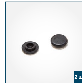
2 шт. Заглушки для направляю- щих при монтаже на проем