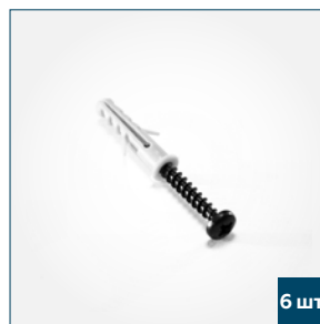
6 шт. Шуруп с пластиковым дюбелем