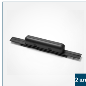
2 шт. Ручка тяговой планки