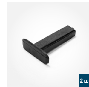
2 шт. Заглушка тяговой планки