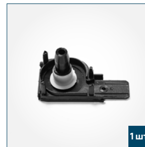
1 шт. Крышка боковая, правая