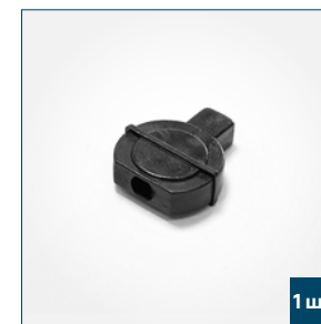
1 шт. Колокольчик для шнура