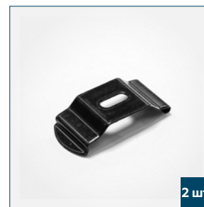
2 шт. Крепления для монтажа короба в проем