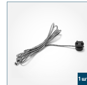
1 шт. Шнурок управления тяговой планки, 1000 мм